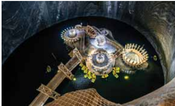
تصویر ۲. نمایی از سالینا توردا