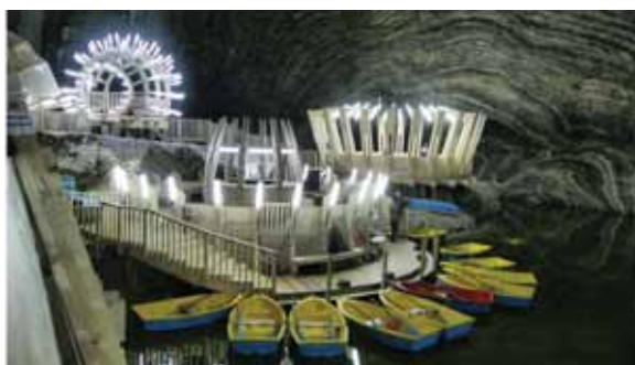
تصویر ۹: پیست قایق‌رانی