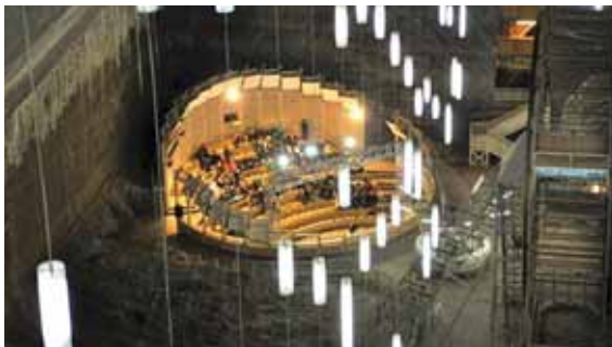
تصویر ۳. سالن آمفی تئاتر سالینا توردا