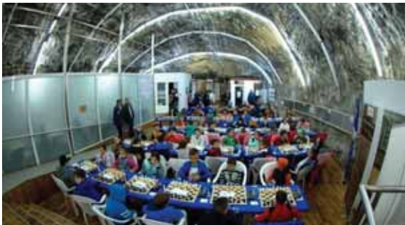
تصویر ۵: برگزاری مسابقات در سالینا توردا