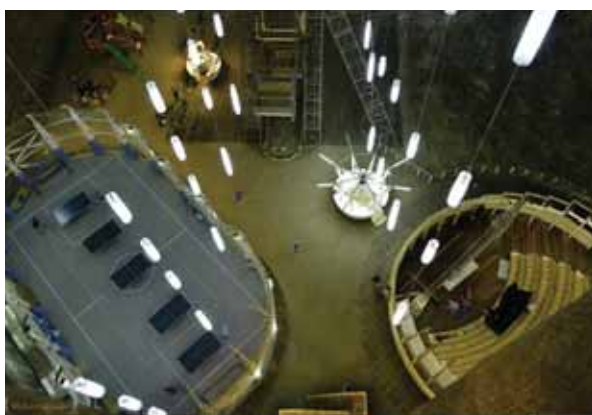
تصویر ۸: زمین مخصوص پینک‌پنگ و سالن آمفی‌تئاتر