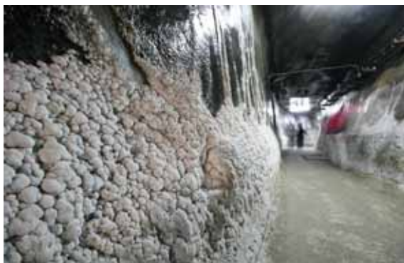
تصویر ۶: نمایی از سنگ‌های نمک معدن