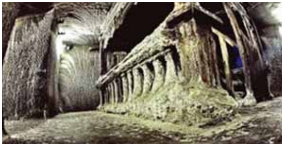
تصویر ۴: بخش حفاری معدن