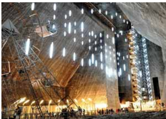
تصویر ۷: آسانسور و چرخ و فلک معدن