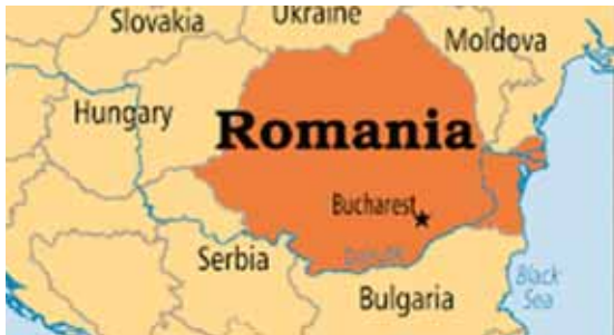
تصویر ۱. نقشه همسایگان رومانی