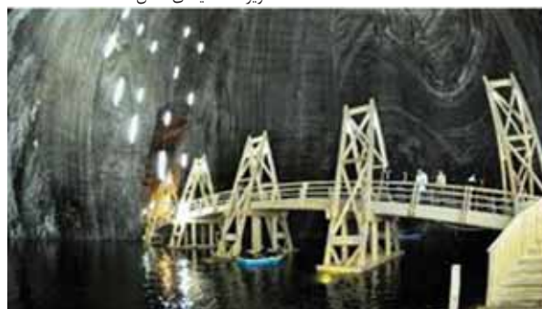
تصویر ۱۱: پل آبی روگذر معدن

نمک دیگری نیز وجود دارد که بعضی از امکانات سالی‌نا توردا در آن‌ها موجود است. از جمله این معادن، معدن پرید با عمقی حدود ۱۶۰ متر و طول ۱/۳ کیلومتر است. این معدن که نمکی با عمر حداقل ۵۰۰ سال در آن انبار شده، در نزدیکی بخارست قرار دارد. وجود زمین فوتسال و بدمینتون، پارک بازی برای کودکان، تندیس‌ها و اشیای ساخته‌شده از سنگ‌های نمکین، کلیسا، امکان دسترسی به اینترنت رایگان، امکان بازدید از راهروهایی با سقف‌های بسیار بلند همراه با نورپردازی زیبا در رگه‌های نمک و دیوار و سقف آن به زیبایی این معدن جلوه‌ای خاص داده است. اما معروف‌ترین معدن نمک رومانی که بسیاری از گردشگران به دیدن آن علاقه‌مندند، در توردا قرار دارد.